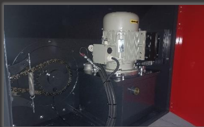
Optionele pompgroep 11 of 15kW