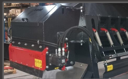
Grotere en wegklapbare snijunit

Voor meer informatie, bezoek onze website www.vdw.be