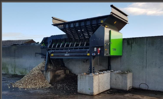
Standaard met 3 opzetranden

De Cleaner Tiger is een stationaire machine om bieten te reinigen en te snijden. Door de 3 meter lange reinigingswals worden alle bieten grondig gereinigd vooraleer deze gesneden worden. Deze machine kan tot wel 20 ton bieten per uur verwerken bij een constante toevoer.