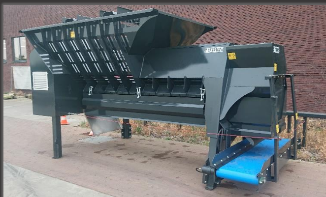
Cleaner Tiger met optionele automatisatie