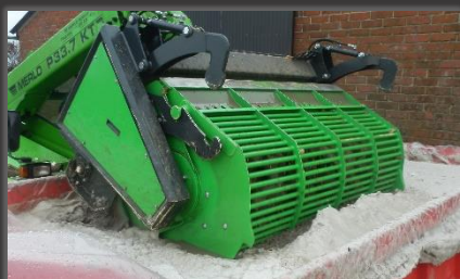
Reinigen in water